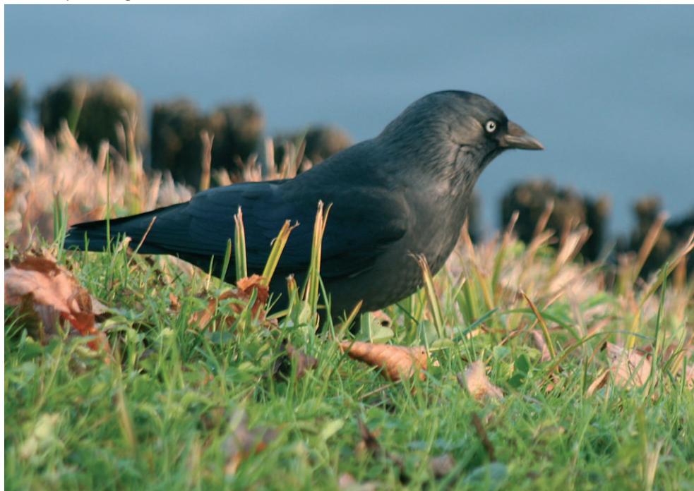
Fot. 3. Kawka z podgatunku Corvus monedula spermologus – Jackdaw Corvus monedula spermologus