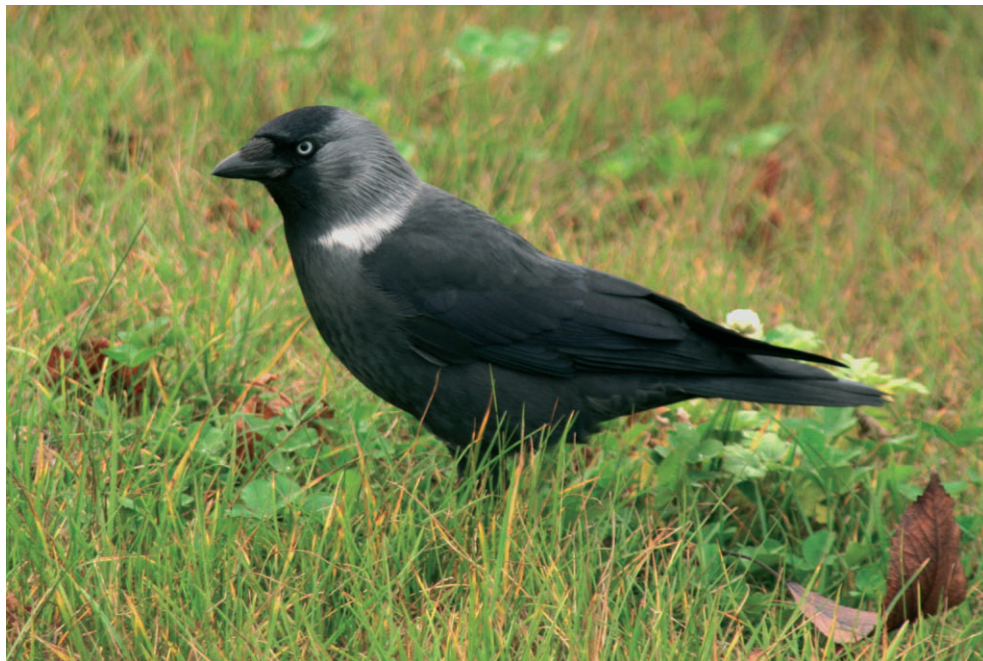
Fot. 1. Kawka z podgatunku Corvus monedula soemmerringii – Jackdaw Corvus monedula soemmerringii

ków ze wschodniego podgatunku niebieskawy połysk na czapeczce, choć cecha ta jest trudno zauważalna w terenie i wymaga odpowiedniego oświetlenia w trakcie obserwacji.