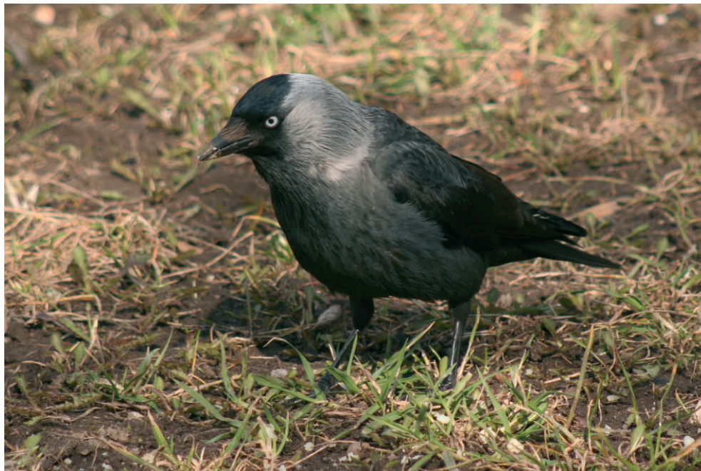
Fot. 2. Kawka z podgatunku Corvus monedula monedula (fot. M. Polakowski) – Jackdaw Corvus monedula monedula